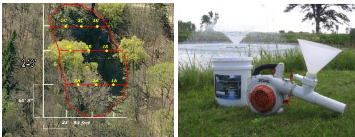
Obr. 5 Fotodokumentace práce s biopreparáty pro redukci množství sedimentů na dně malé vodní nádrže v zahraničí (stanovení rastru a bodů pro aplikaci roztoku, zařízení pro roztřik připravené směsi vody a biopreparátu)

Obrázek 5 dokumentuje přístup k aplikaci biopreparátu u malé vodní nádrže. Prvním krokem následujícím po průzkumu kvality vody a stavu sedimentů, je příprava plánu aplikace, vytyčení kostry míst určených k aplikaci. Ta je možná buď z loďky, nebo vhodným typem roztřikovače směsi vody s biopřípravkem. Důležitá je rovnoměrná aplikace, nebo využití dávkování do přítoku. Následné rozšíření směsi po vodním prvku se zajistí vlastním tokem vody (viz např. aplikace srážení fosforu na přítoku do Brněnské přehrady, více např. http://www.pmo.cz/cz/media/aktuality/povodi-moravy-spousti-provoz-aeracnich-vezi-a-davkovani-siranu-zeleziteho-x/ ).