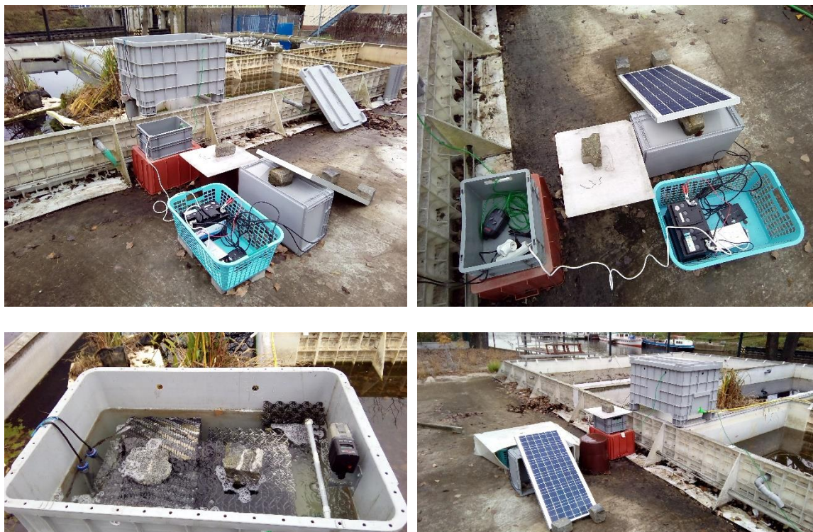
Obr. 2 Příklad instalace bioreaktoru, solárního napájení a technologických součástí

Příklad využití bioreaktoru pro dávkování vodního roztoku s namnoženou biomasou mikroorganismů z biopreparátu dokládá obrázek 2. na obrázku 3 je příklad schéma zařízení, které může být využito pro návrh konstrukce a realizaci dle místních podmínek.