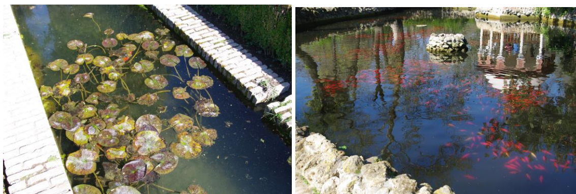
Obr. 4 Neudržovaný porost leknínu ve vodním kanále historické zahrady (vlevo), hledání rovnováhy mezi estetickým působením početné rybí obsádky a kvalitou vody (vpravo) vhodně zvoleným poměrem počtu ryb na velikost nádrže

Vliv na zvýšení eutrofizace vody má i přítomnost vodních ptáků, zejména pokud jsou návštěvníky krmeny. To platí také pro nekontrolované krmení ryb.