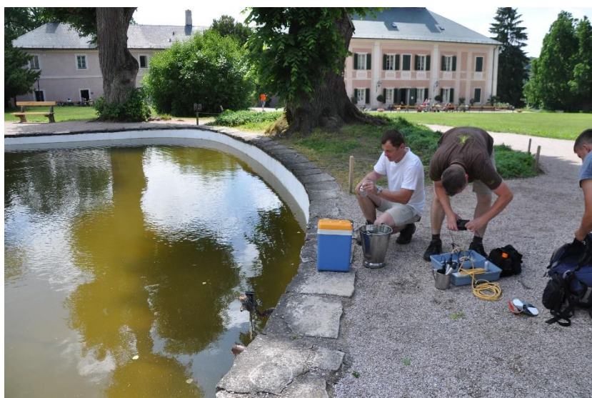
Obr. 1 Příklad měření fyzikálně-chemických veličin vody v terénu pomocí přenosného přístroje, zjišťování průhlednosti vody Secchiho kotoučem a odběru vzorků vody